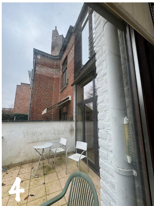
Vue mur mitoyen à rehausser de \pm 24 cm